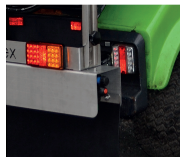
Born i rustfri stål og sidedyser