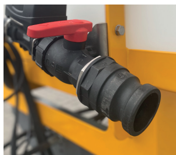
Påfyldningskobling i front