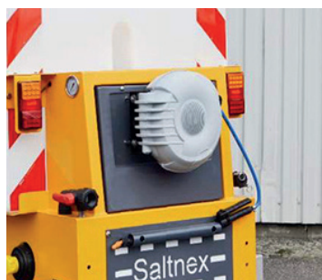
12 m slangerulle med håndlanser